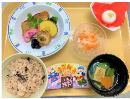
元旦1月1日 赤飯・赤魚西京漬焼き おせち・お吸い物 干支まんじゅう