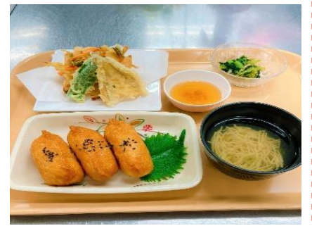
1月3日 いなり寿司・天ぷら盛合せ 小松菜のポン酢和え お吸い物