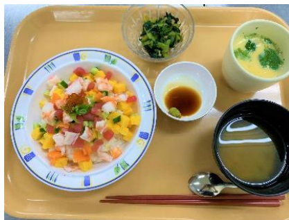
1月2日 海鮮バラちらし・茶碗蒸し 青菜のお浸し みそ汁