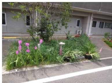
こんなに草ぼーぼーだった ところが…