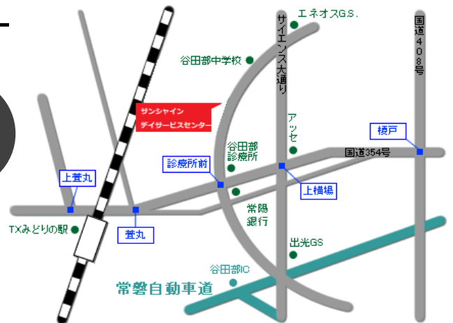
「サンシャイン・クリニック」建物内